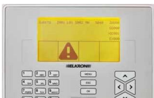
AMARELO Sistema em Falha