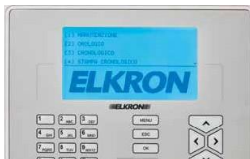
AZUL Sistema em manutenção/ programação