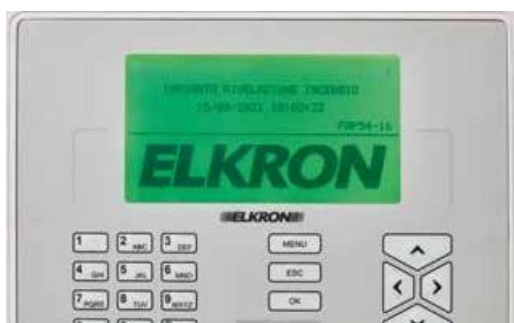
VERDE Sistema OK

O novo visor RGB destaca os status da unidade de controle em diferentes cores. As cores simplificam o trabalho do instalador, pois facilitam o reconhecimento do status do sistema e a detecção de quaisquer falhas ou alarmes em andamento. Mesmo quando não está próximo ao painel.