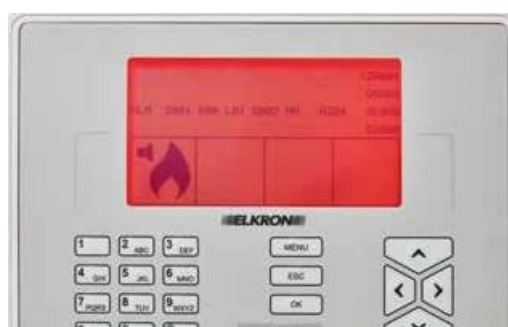
VERMELHO Sistema em alarme